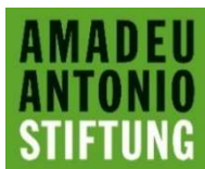
Amadeu Antonio Stiftung

Die folgenden Mitgliedsorganisationen des Netzwerks Kinderrechte zeichnen den Brief mit: