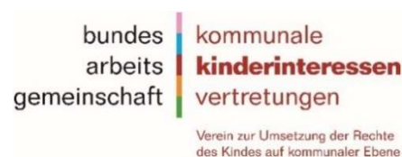
BAG Kinderinteressen e. V.